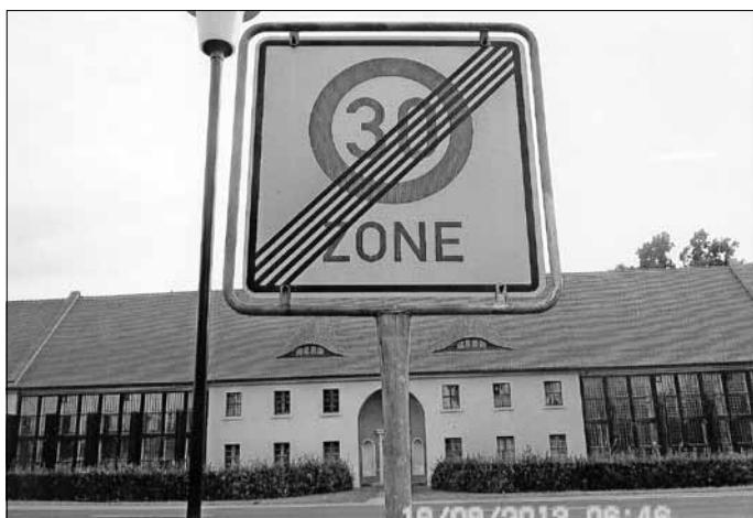
Ende einer Tempo 30-Zone Hier in Oranienbaum gegenüber der Orangerie

Die Gebietsverkehrswacht wünscht allen am Verkehr Teilnehmenden allzeit „Gute Fahrt“ und unseren Schülern einen guten Start ins neue Schuljahr. Ihre Gebietsverkehrswacht Oranienbaum Reinhard Kuhnt Gebietsverkehrswacht Oranienbaum