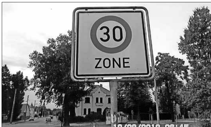
Beginn einer Tempo 30-Zone Hier in Oranienbaum Dessauer Str. Einmündung Franzstr.