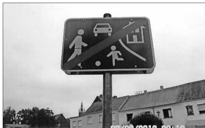
Ende eines verkehrsberuhigten Bereiches (Hier gegenüber der Bäckerei Elster in Wörlitz)