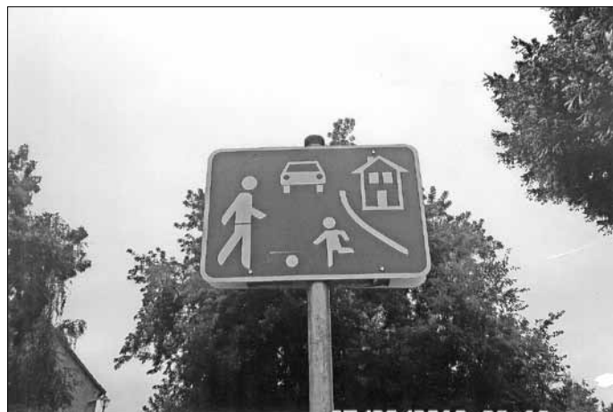
Beginn eines verkehrsberuhigten Bereiches (Hier in Wörlitz Hainichengasse)

Hier konnten insgesamt 24 Verkehrszeichen abgebaut werden. Auch hier ist anzumerken, dass zahlreiche Fahrer sich kaum an die 30 km/h halten. Die Konsequenzen bei einem Unfall und hinsichtlich des eigenen Versicherungsschutzes wird von diesem Personenkreis nicht erkannt.