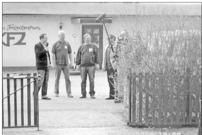
Das Fernsehteam bei uns zu Gast zu Außenaufnahmen zur Sendung „Mach Dich ran“ Interview mit den Gästen der Verkehrswacht Teutschenthal