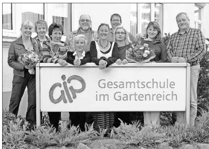
Gruppenbild des alten und neuen Vorstandes und der Rechnungsprüferinnen des Förderverein „Gesamtschule im Gartenreich“ e. V.

Förderverein „Gesamtschule im Gartenreich“ e. V. Amtsgericht Stendal VR2202