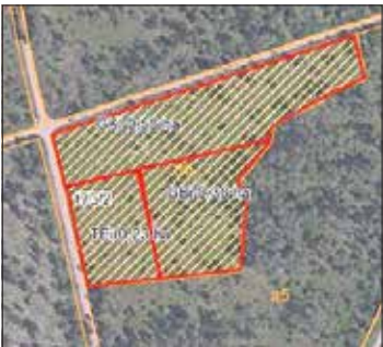
Fläche 2 mit 1,16 ha