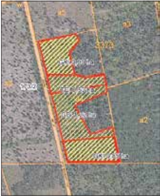
Fläche 3 mit 3,50 ha