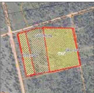
Fläche 1 mit 1,75 ha

Mit einem Gesamtvolumen von rund 85.000 Euro wird das Projekt zu 85 % durch das Landesförderprogramm finanziert. Drei unterschiedliche Waldflächen werden bepflanzt, wobei insgesamt mehr als 50.000 Bäume – darunter Kiefern, Birken und Traubeneichen – in den Boden gesetzt werden.