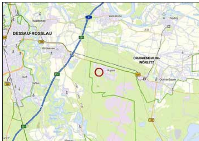
Übersichtsplan

Die Lage des Geltungsbereiches des Bebauungsplanes Nr. 14/2021 „Freiflächenphotovoltaikanlage an der B107“ der Stadt Oranienbaum-Wörlitz ist auf dem nachfolgend abgedruckten Kartenausschnitt ersichtlich.