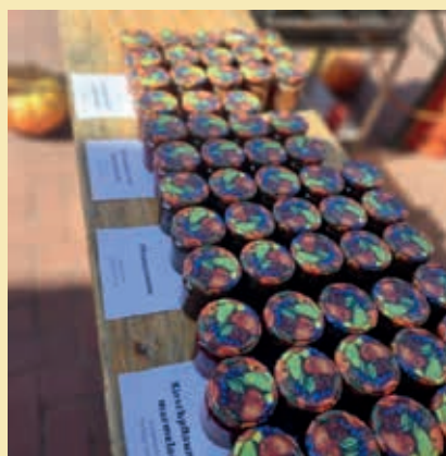
Foto: Selbstgemachte Marmeladen

gebannt in ferne Welten ein. Für die passende Erfrischung sorgten hausgemachte Tees und Limonaden, die uns von Paulberger zur Verfügung gestellt wurden. Ergänzt wurde das Angebot durch herbstliche Dekoration, kunstvolle Papierbasteleien und eine große Auswahl an selbstgemachten Marmeladen. Viele Gäste nutzten die Gelegenheit, kleine Andenken zu erwerben und damit zugleich den Förderverein zu unterstützen.