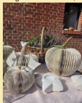
Foto: Handgefertigte Apfel- und Kürbisdeko

brezeln, die reißenden Absatz fanden. Auch das reichhaltige Kuchenbuffet lockte zahlreiche Besucherinnen und Besucher an und war im Nu nahezu leergefegt. Besonders beliebt war zudem der Stand mit handgefertigten Schätzen. Liebevoll genähte Kissen, bunte Stoffbeutel und kleine Mitbringsel, die von engagierten Müttern hergestellt worden waren, fanden großen Anklang.