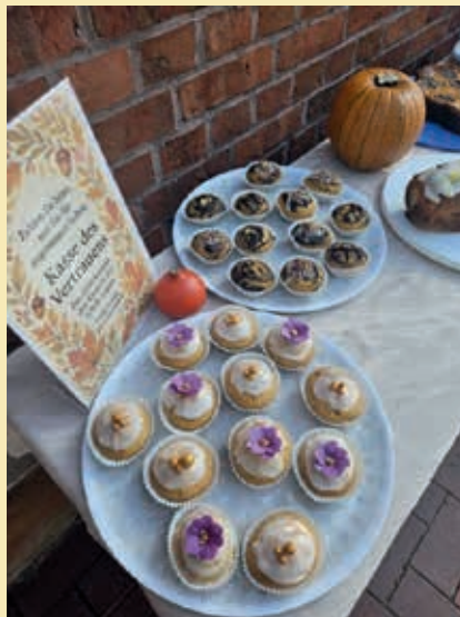
Foto: Bunter Kuchen- und Muffinstand

Schon beim Betreten des Schulhofs bot sich den Gästen ein buntes Bild. Am „Breznwall“ hingen offenfrische Laugen-