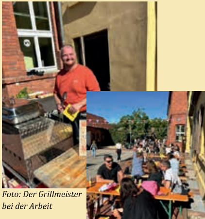
Foto: Der Grillmeister bei der Arbeit

So bleibt am Ende die Gewissheit: Dieses Herbstfest war ein Höhepunkt im Schulalltag der Luisenschule Wörlitz – ein Tag, der Gemeinschaft stärkte und Kinder wie Erwachsene gleichermaßen erfreute.