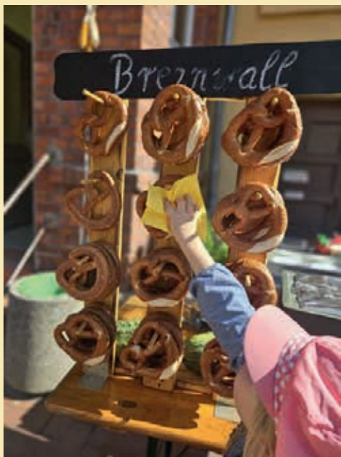
Foto: Leckere Brezeln vom Breznwall

Strahlender Sonnenschein, fröhliches Kinderlachen und der Duft von frisch gebackenem Kuchen. So präsentierte sich am Freitag, den 19.09. das diesjährige Herbstfest an der Luisenschule Wörlitz. Dank der tatkräftigen Unterstützung zahlreicher Helferinnen und Helfer sowie großzügiger Sponsoren wurde die Veranstaltung zu einem unvergesslichen Erlebnis für Groß und Klein.