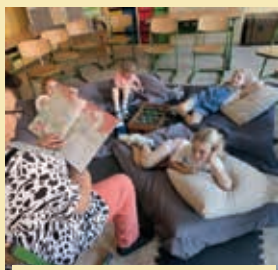
Foto: Unsere Leseoma liest das NEINhorn

Eine besondere Attraktion war auch in diesem Jahr wieder unsere „Leseoma“. In einem gemütlich vorbereiteten Raum, ausgestattet mit Sitzsäcken, die von Getränken Raven gesponsert wurden, lauschten die Kinder ihren Geschichten und tauchten