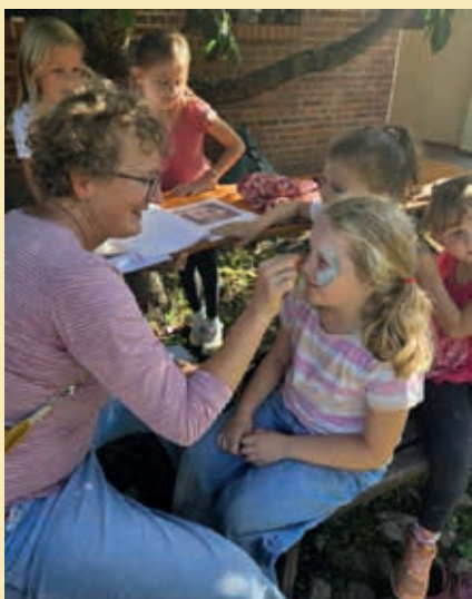
Foto: Schülerin beim Kinderschminken