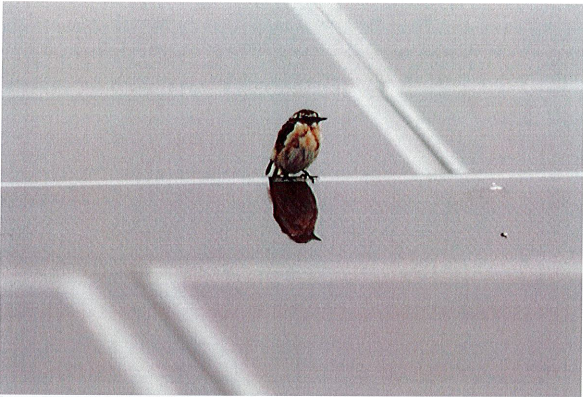
Foto 5: Braunkehlchen auf Solarmodul, Schönewalde, 13.07.2012.