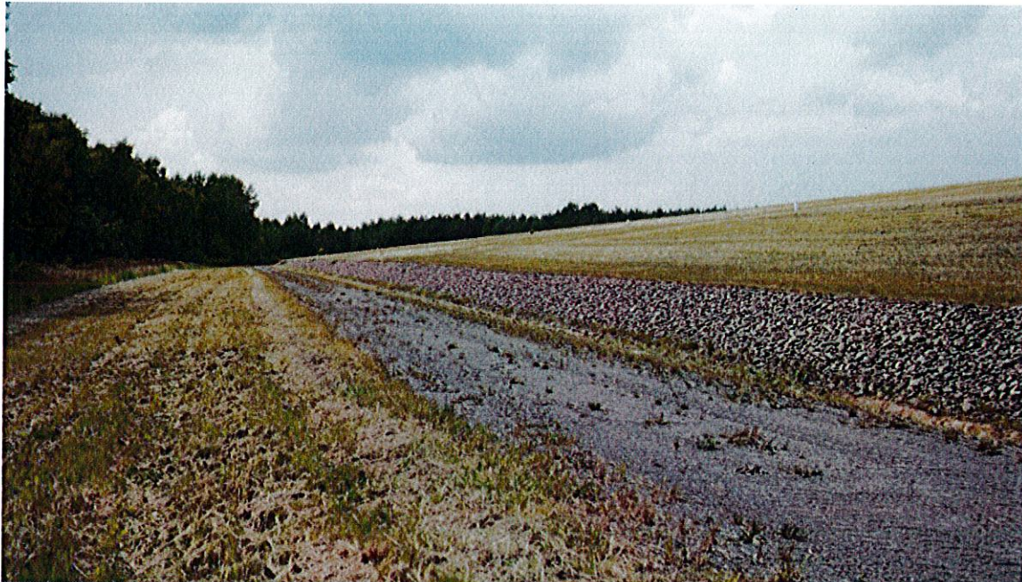
Foto 1: Der Deponiekörper mit Randbereich, 28.06.2013.