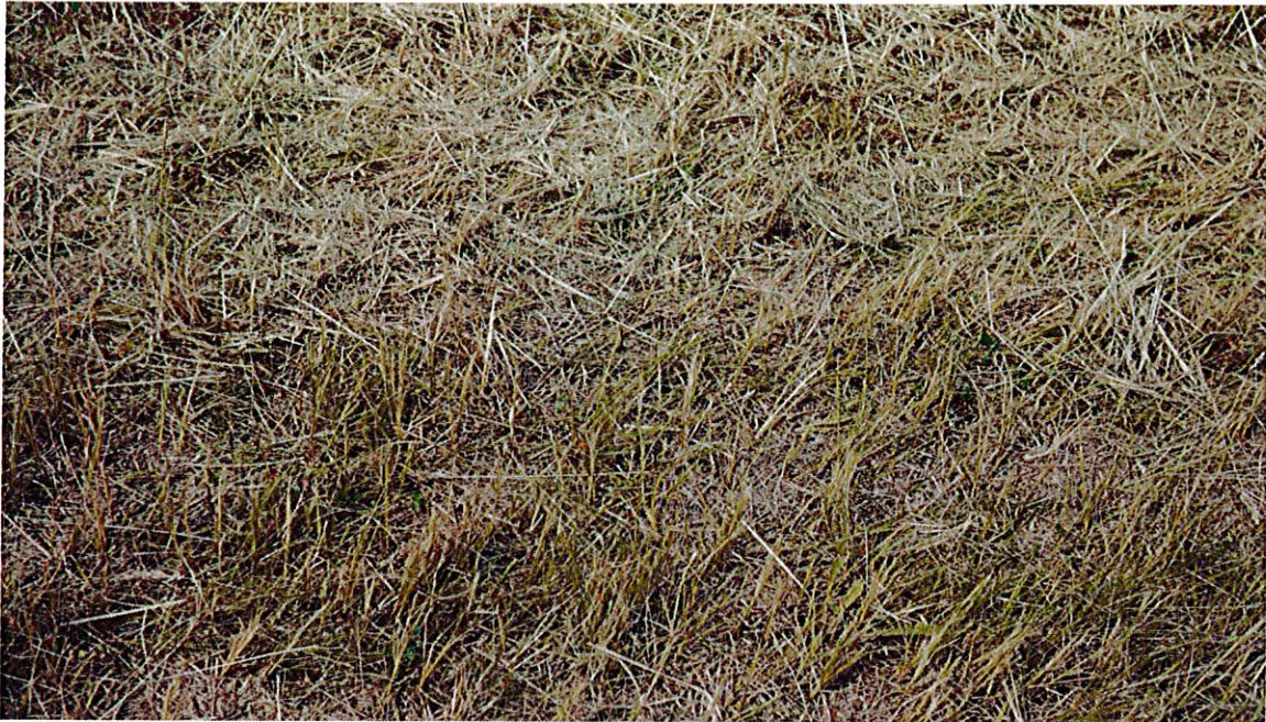
Foto 3: Homogene und artenarme Bodenvegetation, Mulchmahd verstärkt die Verarmung durch uniforme und nährstoffanreichernde Bodenabdeckung.