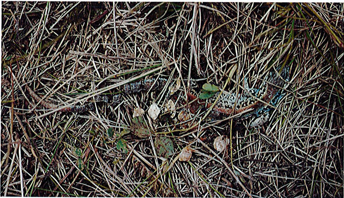
Foto 6: Totfund Zauneidechse, adultes ♀, 28.06.2013.