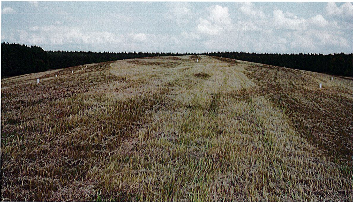
Titelbild: Blick über die Kuppe des Deponiekörpers in Richtung Ost, 02.06.2013.

Im Auftrag von ifu GmbH Hoher Weg 7 39576 Stendal