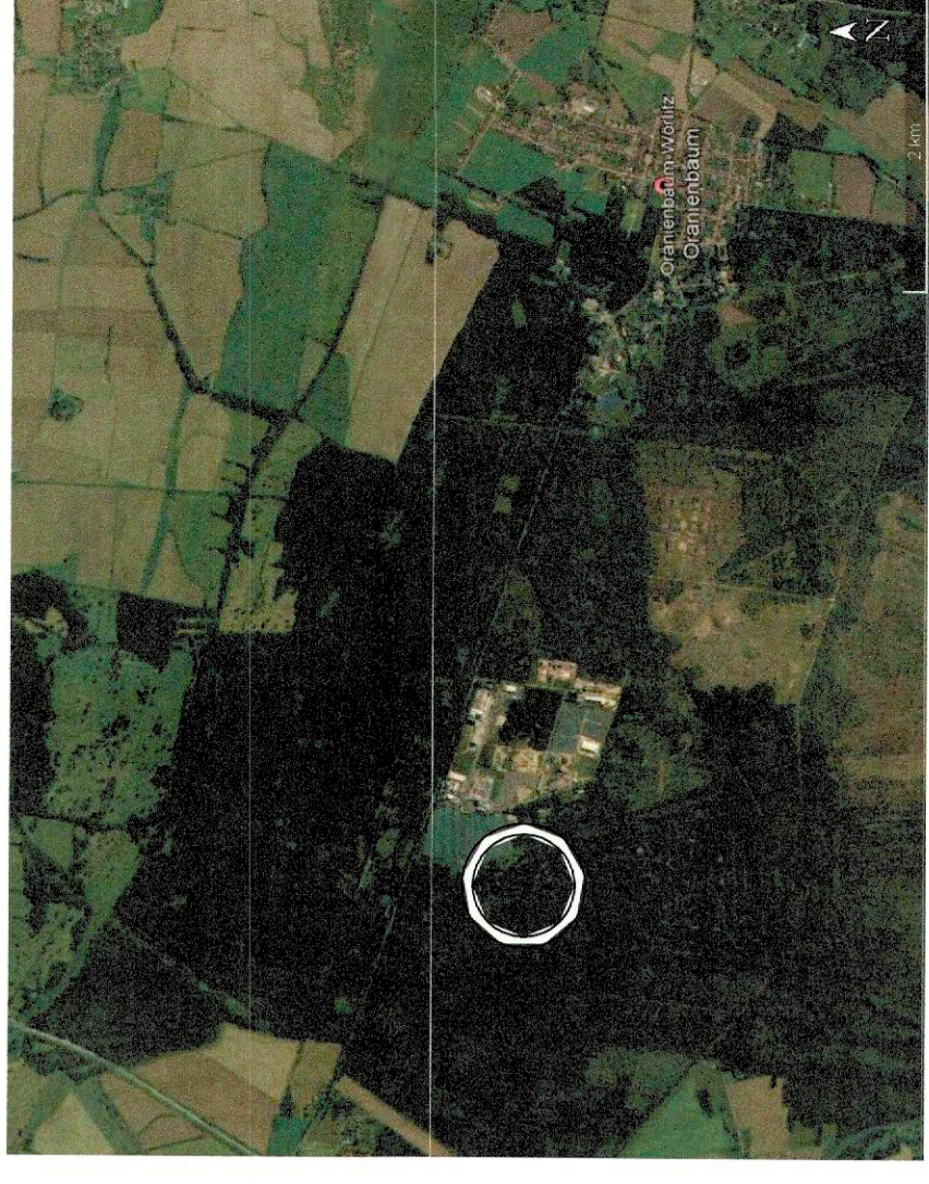
Übersichtsplan o.M. Auszug vom 28.03.2022

Stadt Orianenbaum-Wörflitz, den 03.05.2025 Bürgermeister