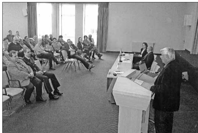
Unser Präsident zugleich Vizepräsident der Landesverkehrswacht beim Verlesen des Finanzberichtes 2013