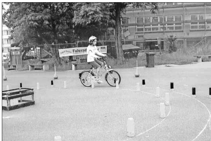
Geschicklichkeit und Konzentration ist beim Durchfahren des ADAC-Parcours gefragt

Im April wurden in Oranienbaum und Vockerode unsere Verkehrsteilnehmerveranstaltungen für Senioren erfolgreich durchgeführt. Die Veranstaltung im OT Wörlitz sowie eine weitere für die Frauensportgruppe „Anhalt“ wird im Mai nachgeholt.